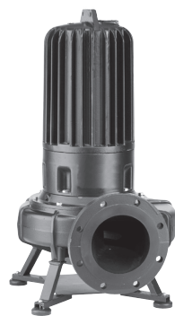
MULTISTREAM 300/4 C7