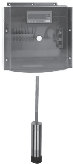
DÉTECTEUR DE PRESSION HTS 04