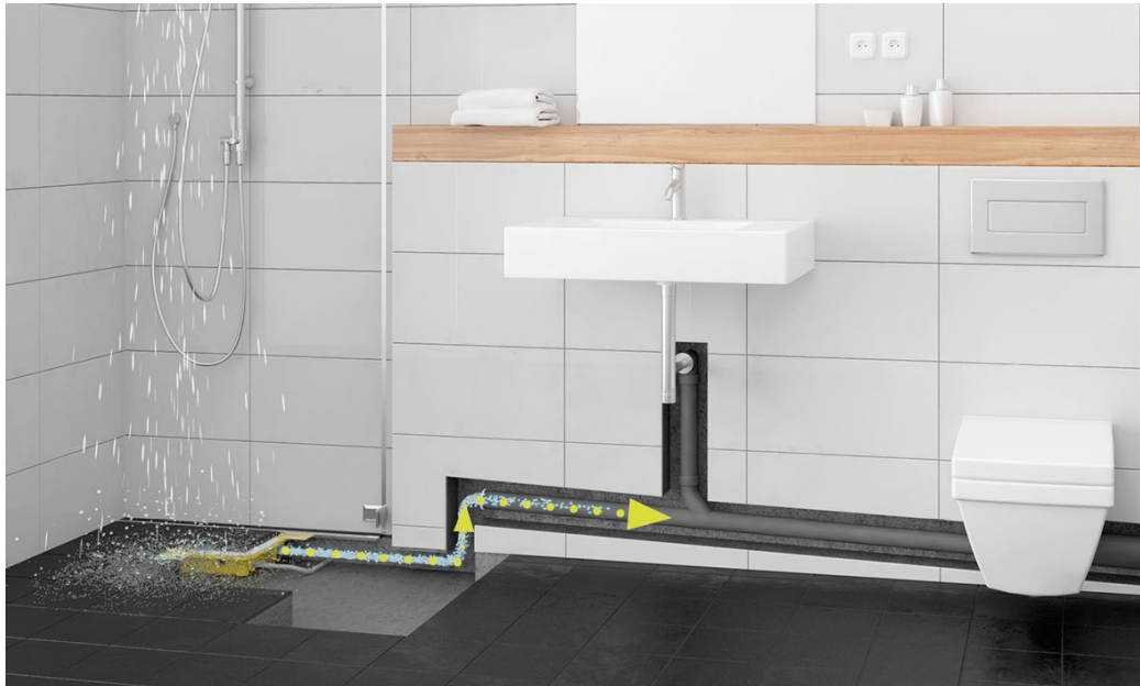
Bild 2: Das Duschabwasser läuft in den Plancofix-Behälter und wird in das höherliegende Abwasserrohr gepumpt

Presse Kontakt: Jung Pumpen GmbH Dr.-Ing. Andreas Kämpf Industriestraße 4-6 33803 Steinhagen Deutschland Tel.: +49 5204 17-320 andreas.kaempf@pentair.com