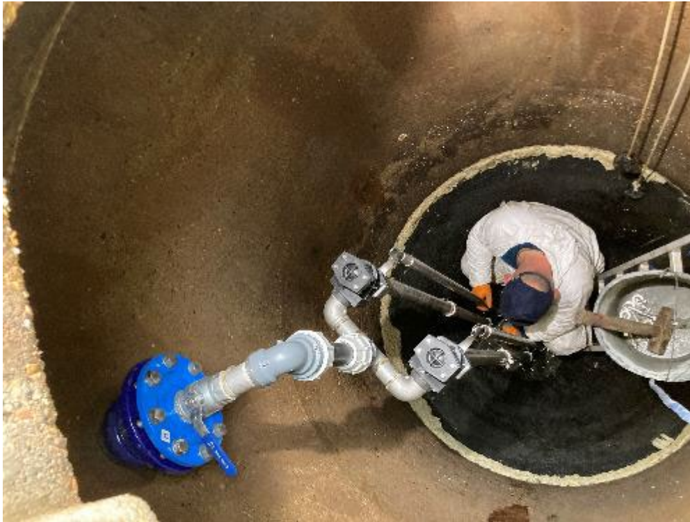
Bild 4: Installation des Einbauset Duo für die künftige Doppelpumpeninstallation