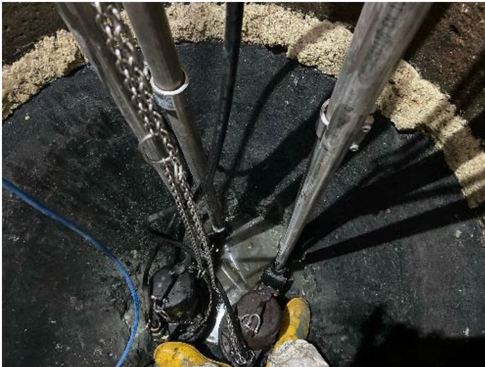
Bild 5: Knapp, aber es passt. Die Pumpen werden abwechselnd in Betrieb genommen und sollte eine Pumpe defekt sein, übernimmt die andere den Notfallbetrieb.