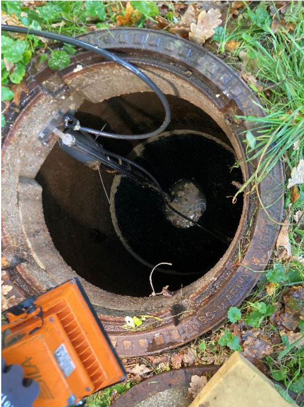
Bild 3: Ursprüngliche Pumpeninstallation mit einer MultiCut Pumpe für die Entsorgung der kompletten Feriensiedlung